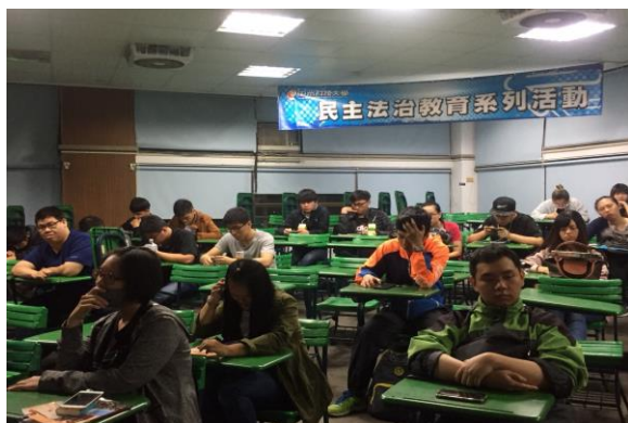
講座專題演講過程同學認真聽講情形