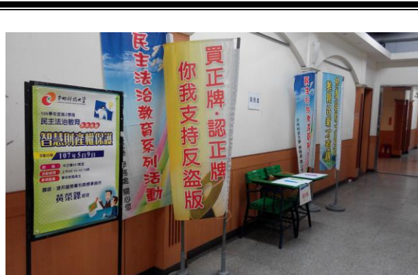
民主法治教育專題演講—智慧財產 權講座現場文宣布置

活動名稱：106-2 學年民主法治教育專題 編號：(3-1-1-44) 演講(智慧財產權) 活動日期：107年5月9日 活動地點：中正樓307教室 主辦單位：學生會、學務處、軍訓室 參加對象：學校教職員工生