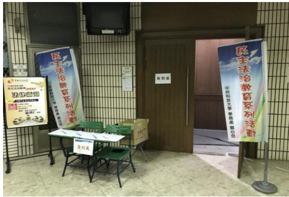
民主法治講座現場文宣布置