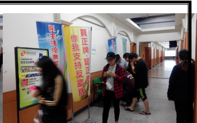
講座開始前參與同學簽到情形