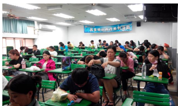
參與民主法治—智財權演講學生認 真聽講情況