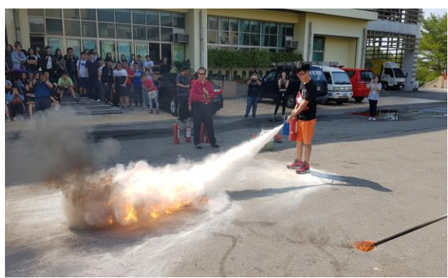
學生滅火器操作演練