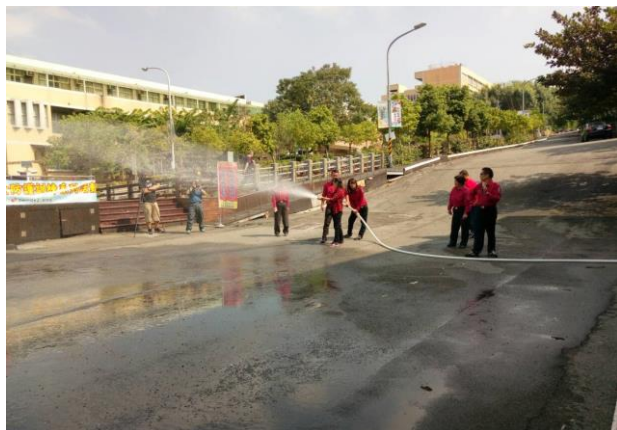
學生消防水帶操作演練