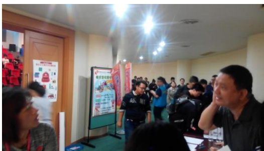
參與演練同學簽到