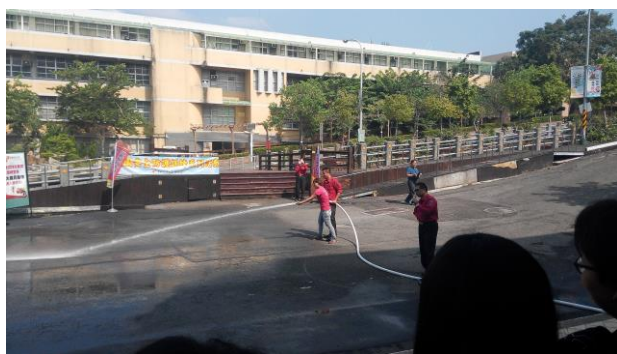
學生消防水帶操作演練