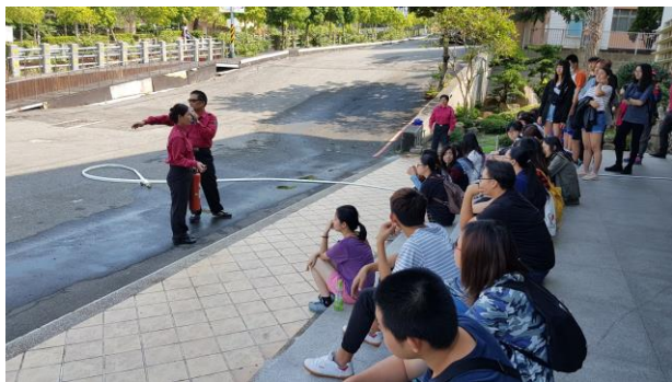
消防水帶操作解說