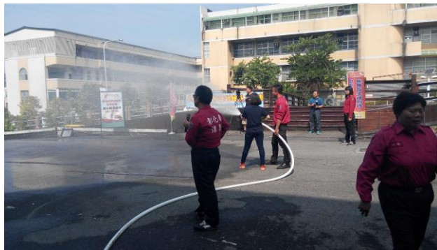
學生消防水帶操作演練