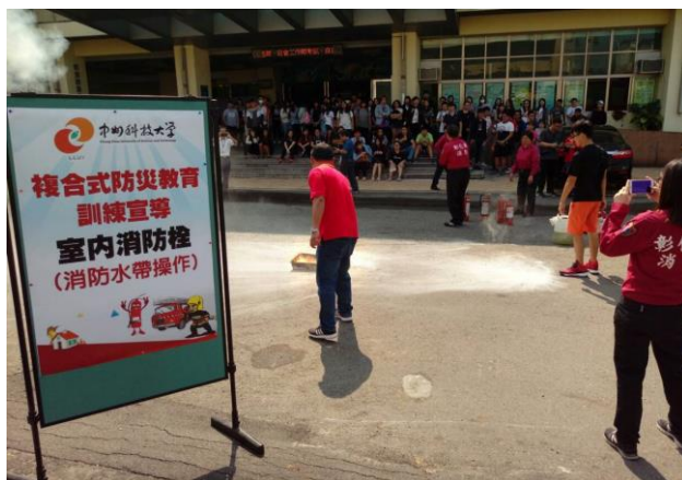
學生消防水帶操作演練