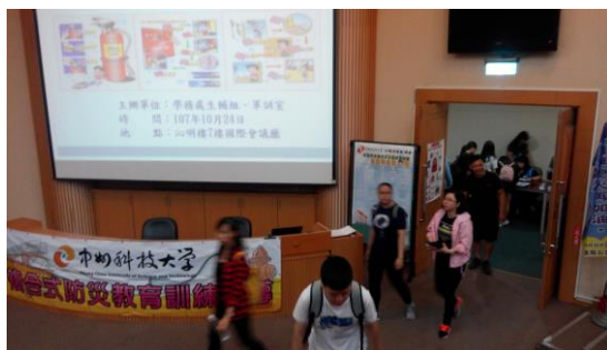
參與演練同學就座