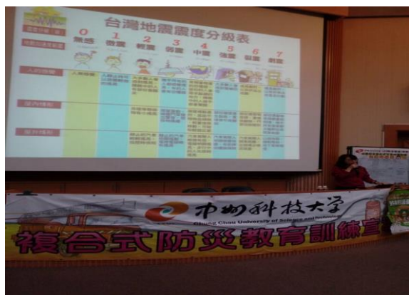
室內說明課程講師上課情形