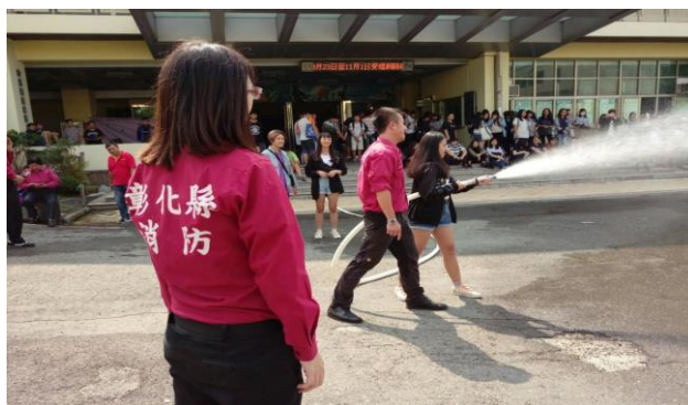
學生消防水帶操作演練