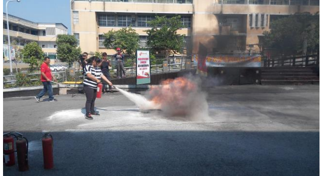
學生滅火器操作演練